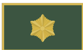
Maleva pealiku abi Ringkonnavanema abi, Malevkonna pealik, jaoskonnavanem Noorteinstruktor