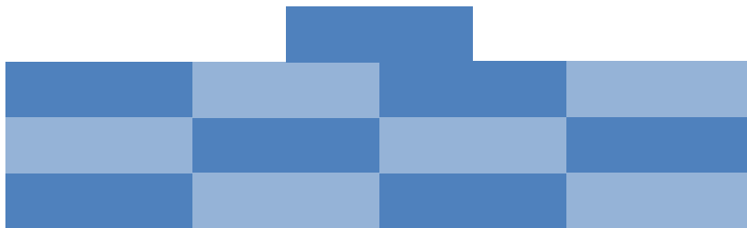
Näide: 1 ülemises ja 4 mõlemas alumises