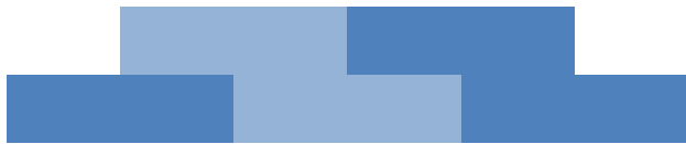
Näide: 2 ülemises, 3 alumises