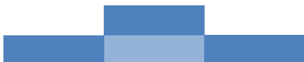
Näide: 1 ülemises, 3 alumises